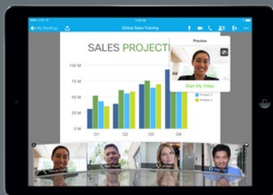
Content Sharing auf mobile Devices

Nutzen Sie Cisco WebEx® auf allen üblichen Betriebssystemen: Windows, Mac, Linux und Solaris sowie über mobile Endgeräte.